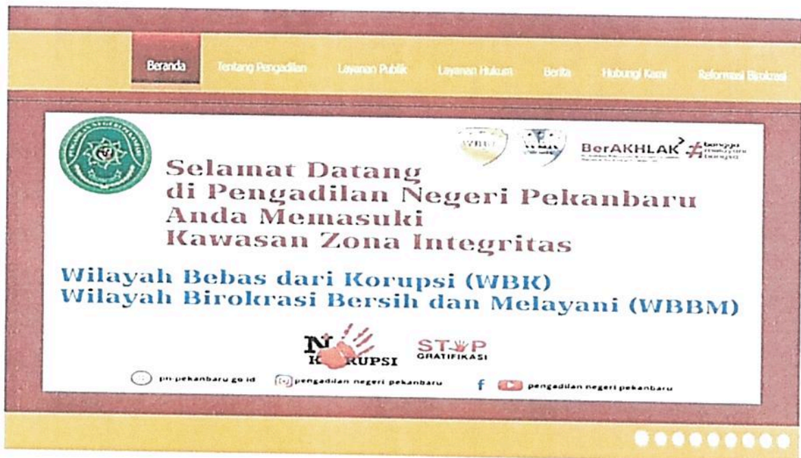
Gambar 1. Website Pengadilan Negeri Pekanbaru Kelas IA